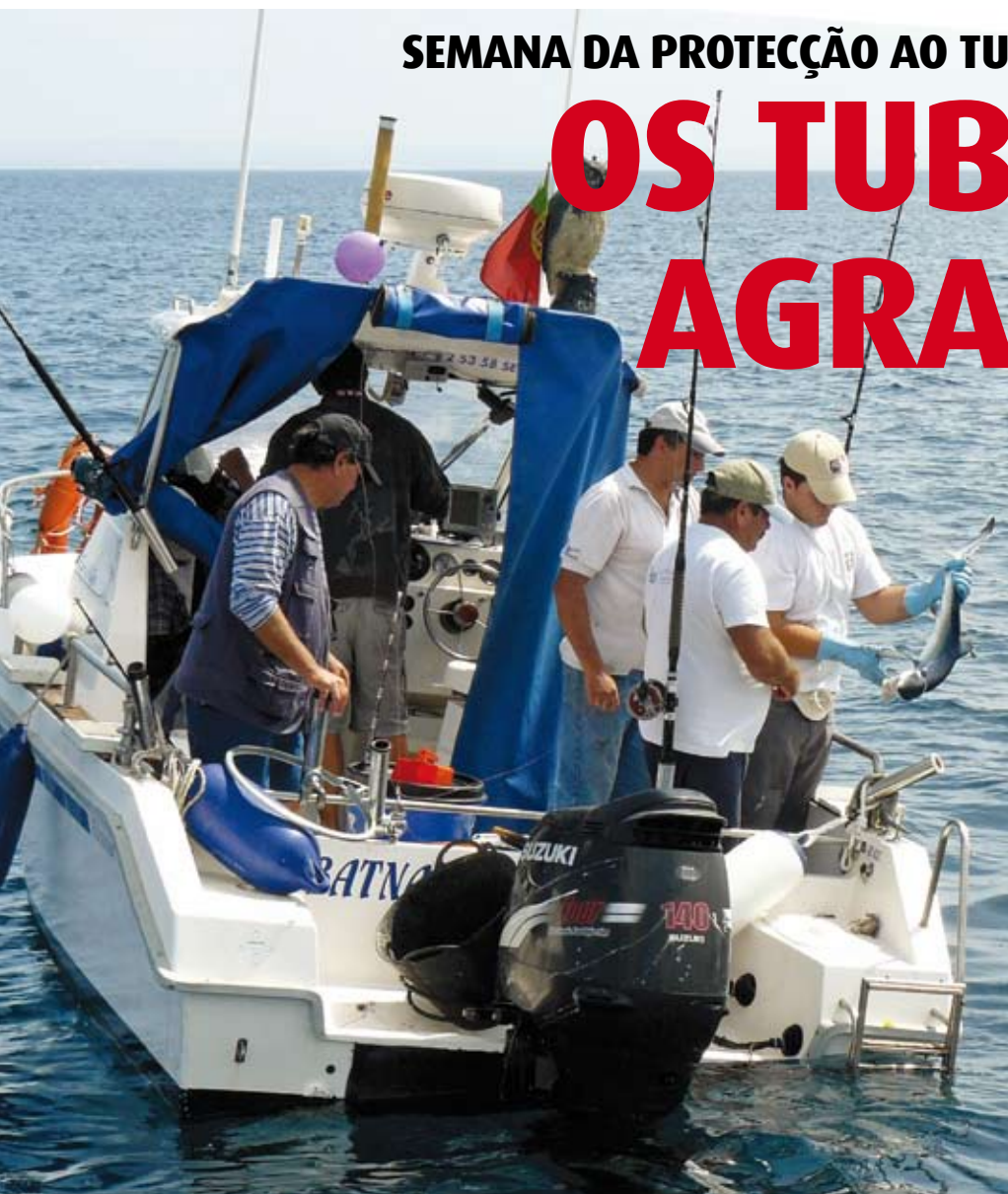
➤ Embarcação Batnávo na marcação e libertação de Tubarões ao largo de Sesimbra